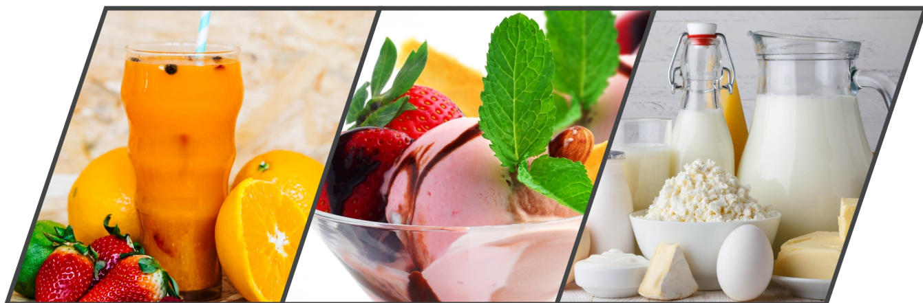
Plate heat exchangers and HTST pasteurizers for the food industry, such as milk, cream, whey, ice-cream mix, fruit juice and egg, among others.

Intercambiadores de calor a placas y pasteurizadores HTST para la industria alimenticia, como ser leche, crema, suero, mix de helados, jugos de frutas y huevo, entre otros.