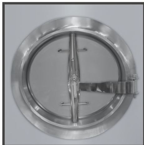
BOCA PASAHOMBRE MAN HOLE