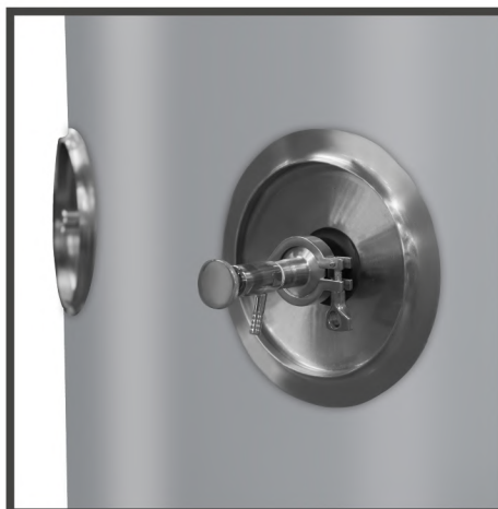
GRIFO TOMAMUESTRAS SAMPLE TAKING TAP