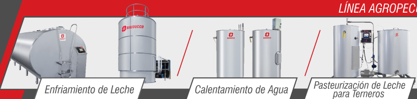
Enfriamiento de Leche